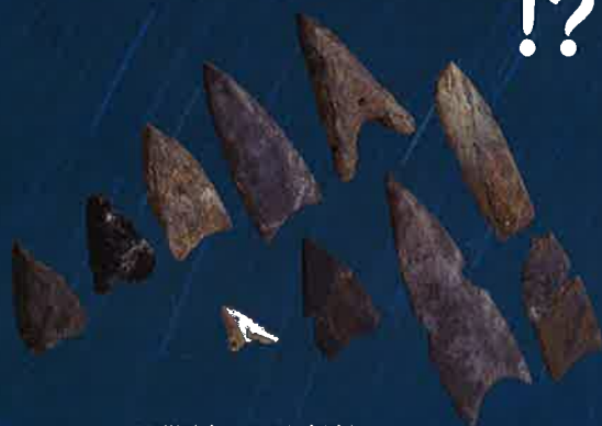
石鏃(吉野ヶ里遺跡) 佐賀県教育委員会所蔵