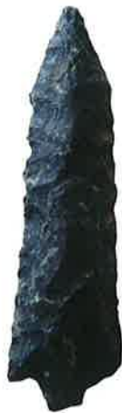
打製石鎌(朝日遺跡・愛知県教育委員会所蔵)