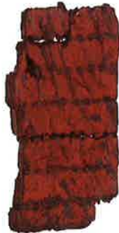
楯(雀居遺跡・福岡市埋蔵文化財センター所蔵)