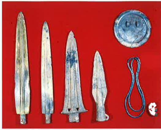
吉武高木遺跡3号木棺墓出土品(福岡市博物館所蔵) ※展示品はレプリカになります。

この特別展では吉野ヶ里遺跡、朝日遺跡(愛知県)といった戦いの痕を残す拠点的な集落であった遺跡を中心に、弥生時代の戦いと当時の社会の様相を描き出すとともに、戦いのなかった稲作農耕集落と語られる登呂ムラの姿を探ります。