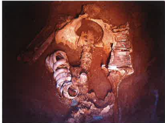
南海産の貝の腕輪(吉野ヶ里遺跡・佐賀県教育委員会所蔵)