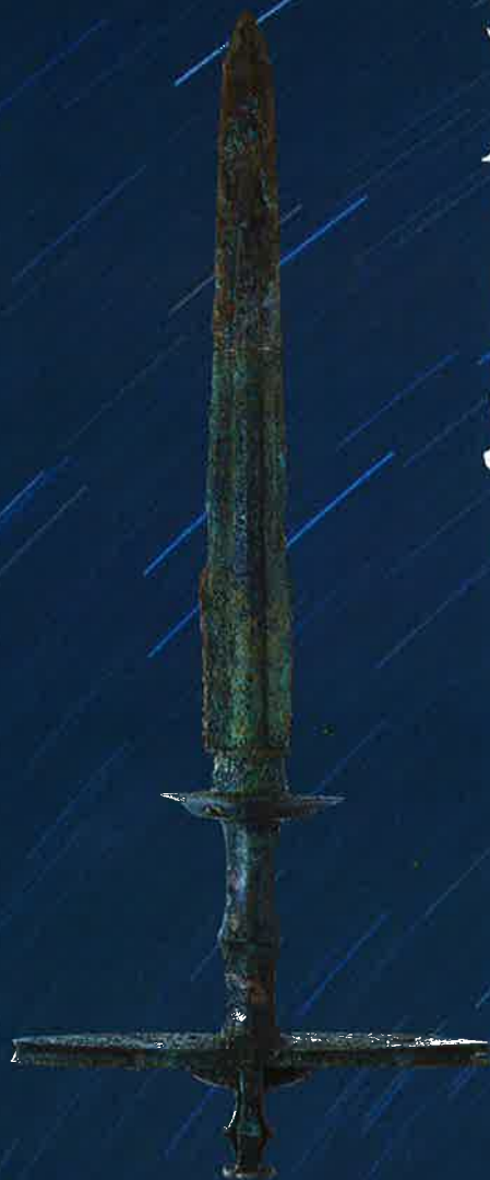
右柄細形銅剣(吉野ヶ里遺跡) 佐賀県立博物館所蔵