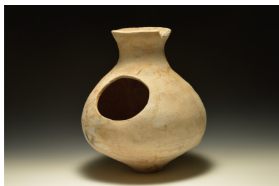
愛知県朝日遺跡出土土器