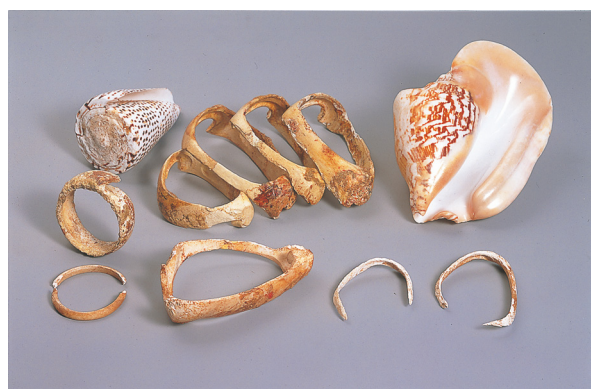
佐賀県吉野ヶ里遺跡出土貝輪類