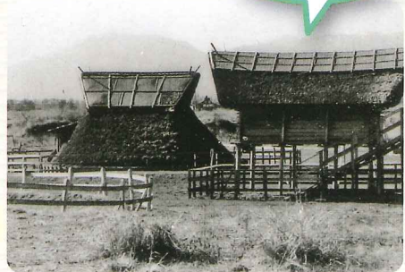
史跡賤機山古墳/須恵器 (静岡浅間神社所蔵)

展示解説 日時 7月20日 日・ 8月10日 日・ 9月14日 日 各日 11時30分～、14時30分～ 会場 登呂博物館2階特別・企画展示室、希望者は直接会場へ(要観覧チケット)